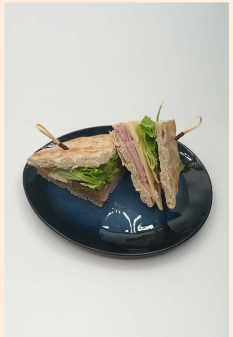
1 DEMI SANDWICH