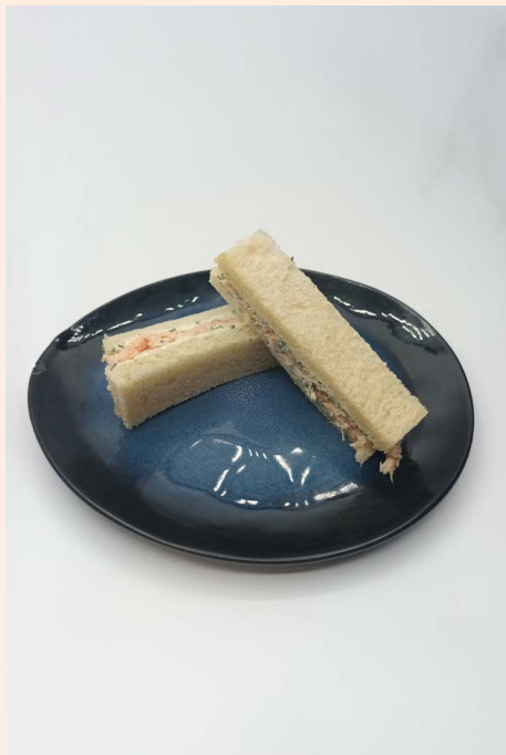
2 FINGERS SANDWICH