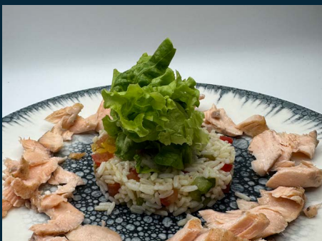
Plats traditionnels ou exotiques