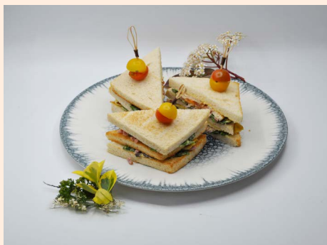
1 DEMI CLUB SANDWICH OU UNE PETITE SALADE