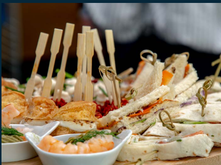
Cocktails déjeunatoires & dinatoires