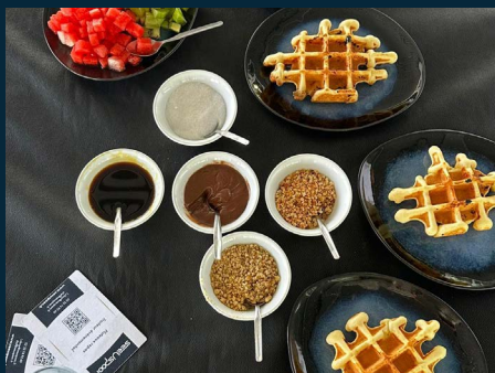
Animation du chef