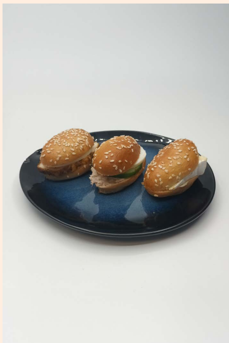
UN TRIO DE NAVETTE