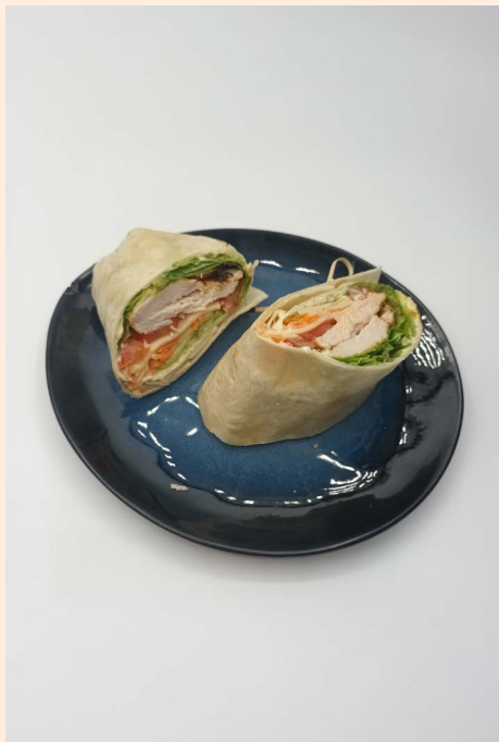
1 DEMI WRAP

Le plateau inclus une bouteille d'eau 50cl, les couverts, une serviette et du pain